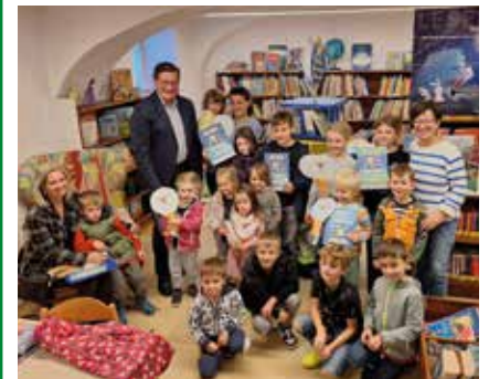
Lesesommer-Aktion in der Bücherei Marz

kann das Friedenslicht im Feuerwehrhaus abgeholt werden. Für Unterhaltung der Kinder und das leibliche Wohl ist bestens gesorgt.