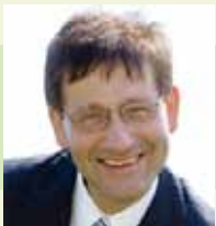
Gerald Hüller Bürgermeister