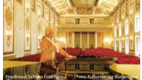
Haydnssaal, Schloss Esterházy

Neusiedler See Tourismus, 7100 Neusiedl am See Tel/Fax +43(0)2167/8600-0 info@neusiedlersee.at , www.neusiedlersee.com www.welterbe.org