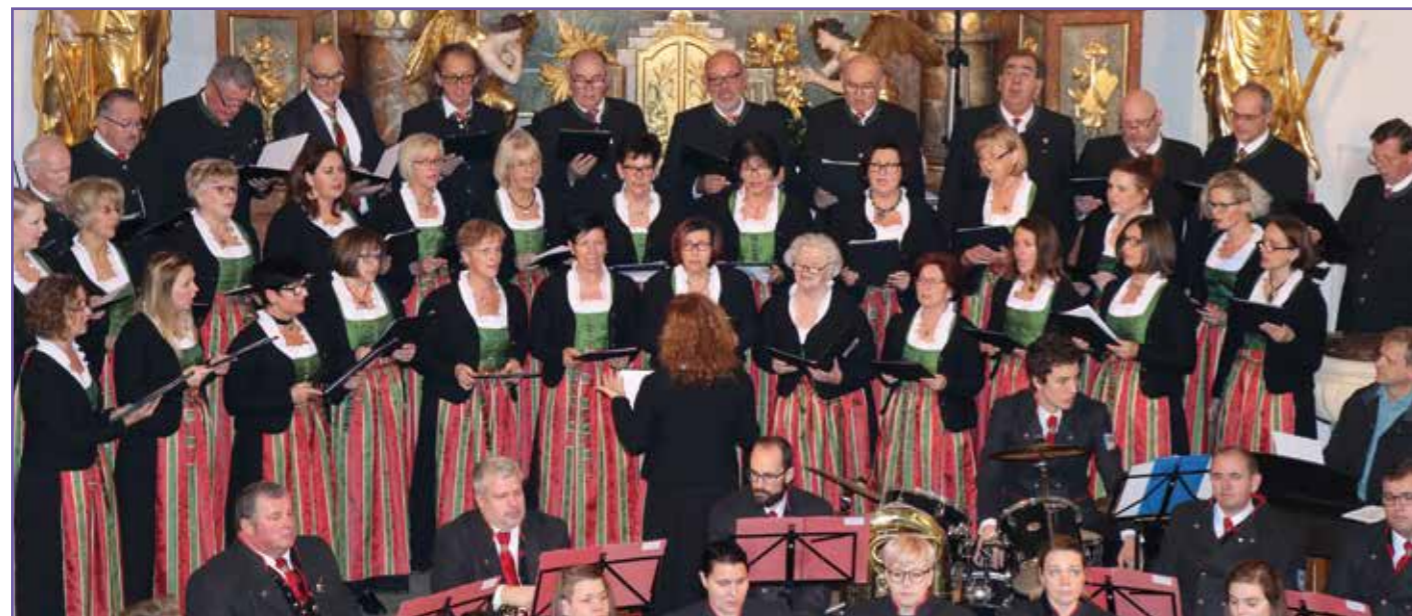
Mit vorweihnachtlichen Liedern und Musikstücken begeisterten Gesangsverein und Musikverein die vielen Zuhörerinnen und Zuhörer

Mit der Mitgestaltung der Sängerrate am 22. Dezember klingt das Jubiläumsjahr musikalisch aus.